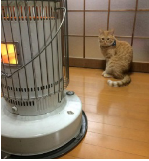
ストーブにすらびる店長

ここ数ヶ月佐清店長のビビりがひどくなっていることが関係者への取材で分かった。アンディンの関係者によれば、元々大きな音や知らない人に対して警戒心の強かった店長のビビりがここ数ヶ月ひどくなっているという。 そのビビりがひどくなったきっかけは去年のテレビ取材以来だと関係者は言う。去年ローカルTVの取材で初のテレビ出演を果たした店長だが、取材の際にカメラマンが